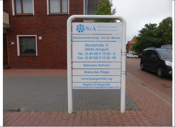
Seniorenwohnanlage Auf der Wierde