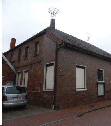
Oberfletmer Straße, ehemalige Apotheke