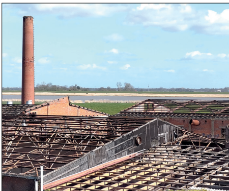
Großbaustelle Ziegelei – in wenigen Wochen wird das Gelände geräumt sein.

Das Projekt „Ziegelstadt“ ist ein gutes Beispiel für Dorfentwicklung. Es zeigt, dass ein Gemeinderat, wenn er sich einig ist, die Gemeinde voranbringen kann. Manchmal haben wir intensiv gerungen – zum Beispiel darüber, ob und wie bezahlbarer Wohnraum auf dem Gelände entstehen kann. Insgesamt hat der Rat dann aber stets zu gemeinsamen Beschlüssen gefunden und das Mammutprojekt vorangetrieben. Das ist ein starker Beleg dafür, dass der Rat handlungsfähig ist – trotz äußerst schwieriger Finanzlage (dazu siehe Seite 2).