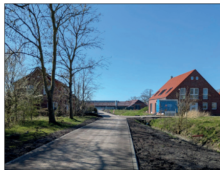
Trotz Finanzkrise – Ausbau oder Instandsetzung von Straßen muss sein – hier aktuell in Hatzum.

Aktuell kommen trotz der schwierigen Finanzlage weitere Investitionen, die wir richtig finden, hinzu, z. B. diese zentralen Vorhaben: